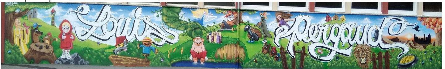
Une photo de la fresque et du chaudron (à gauche).

Et pour finir cet après-midi, tous les participants à la réalisation de ce projet ont été remerciés et un exemplaire du recueil de contes leur a été offert, comme à tous les enfants participants.